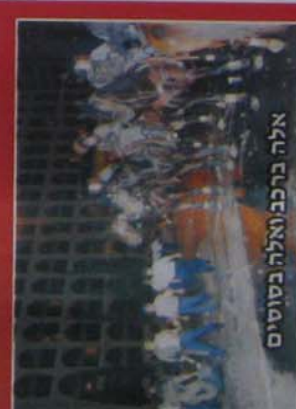
אלה בורכב ואלה כסוסים