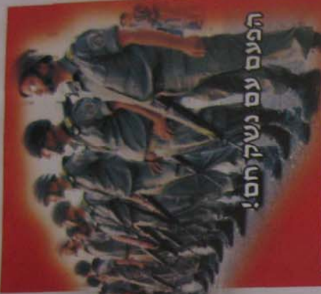
הפעם עם נשק חם!

לאחר החייצנות עם מומחים בענייני רפואה וגם מטעם בית החולים הדסה הר הצופים החלט להעביר את התינוק לטיפול בהדסה עין כרם שם ישנם רופאים בכירים יותר ומומחים ברפואת ילדים. זה כשבעה חודשים שחיימקה מאושפ בהדסה עין כרם, כאשר האמא המסורה (המרעיבה...) לא עזבת את בנה היקר לה מכל, יום יום מהבוקר עד הערב. ורק בערב היא דאגה למתנכות שיבואו