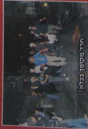
חרד מקומף בכלא!