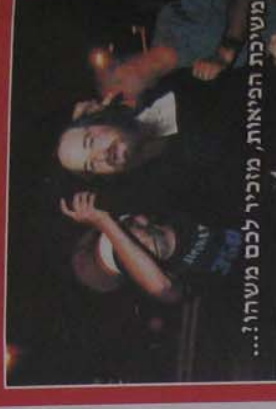
משגיכת הפלאות, מזכירי לכם משהו?...!