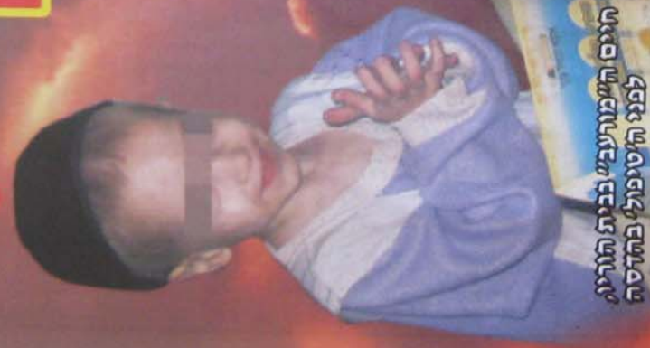
היום ה"מורעבי" בבית הורג לפני הטיפול בהדס