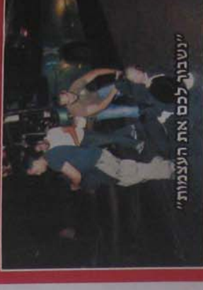
"נעבור לכם את העצמות!"