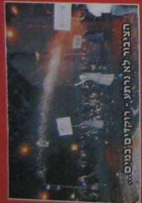
הציבור לא נרתע - רוקיסיבנימס...