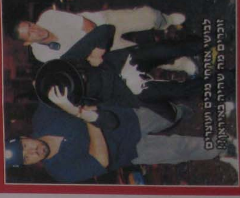
לבושי אזרחי מכיני ועוצבים זוכרים מה שריה באיראן?

ובקש ולא חובל לתת לו. באותו בוקר שנעזרה האמא, לא ידעתי שעצרו את האמא כי זה עדיין היה סודי כמה ימים עם צו איסור פרסום. זקניתי לבני ארטיקי. פניתי לאחות ושאלתי אותה אם מותר לי לקנות גם לילד חימיקה ארטיקי. התשובה ענתה עכשיו כבר מותר. וגם האחות נהנה באותו יום ממחק לילדי".