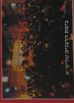
כימות הרבנים שליטי"א