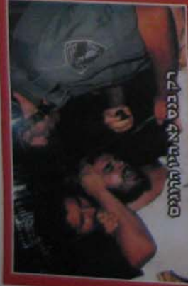
רק בנס לא הילול התנגס