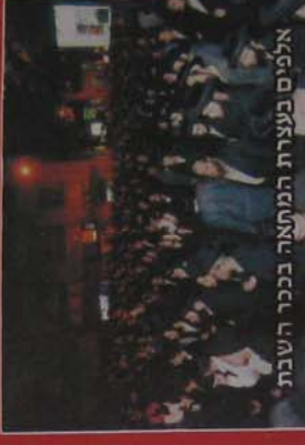
אלפים נעצרו הנחמה בכני השבת