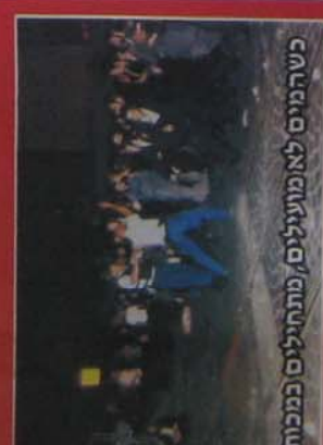
כשהמים לא מועילים, מתחילים כמכות