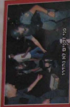
מני זקנים לא נהדרו