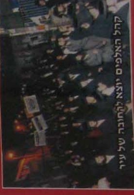
קהל האלפים יוצא להחובה של עיר