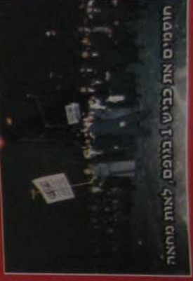
חוסנים את כניש לניופים, לאות מחאה