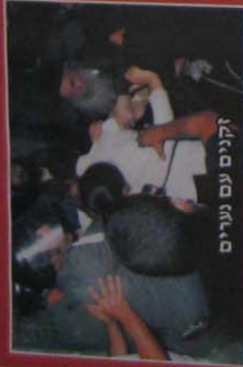
זקנים עם נערים