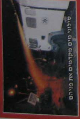
סילוני מים מקדמים את פניהם

בית החולים, אחרי חצי שנה של טיפולי כימותרפיה מסיביים, הבין שהוא טעה, ובמקום להיחשף לתביעת ענק, הוא ממציא