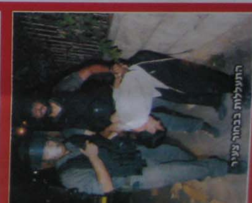
התעללות בכמות צעיר