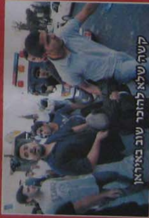
קשה שלא להוכר שוב באיראן