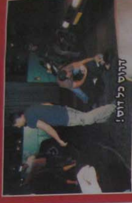
נהרס כל זוס!