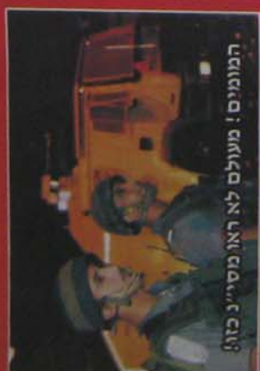
המומים! מעולם לא ראו מסייב כזה!